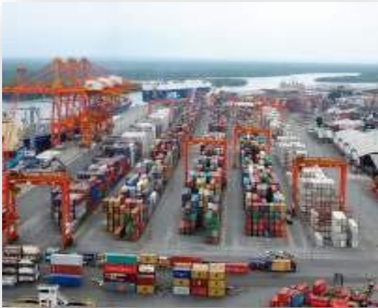
Contecon Guayaquil S.A

31 Mayıs 2007 tarihinde 20 yıllık Kamu Hizmeti İmtiyaz Sözleşmesi imzalanmıştır. Contecon Guayaquil S.A, 1 Ağustos 2007'de faaliyetlerine başlamıştır. 1.625 metre rıhtıma sahiptir.