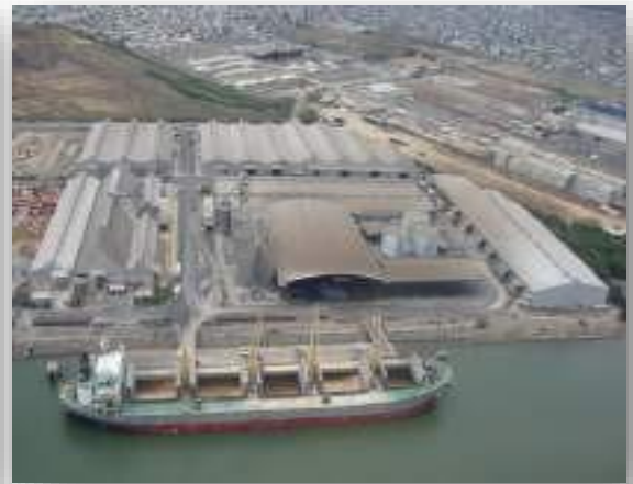
Andipuerto Guayaquil S.A.